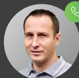
Petr Michal Prodejce vozidel

Zavolejte nám, připravíme vám nezávaznou nabídku.